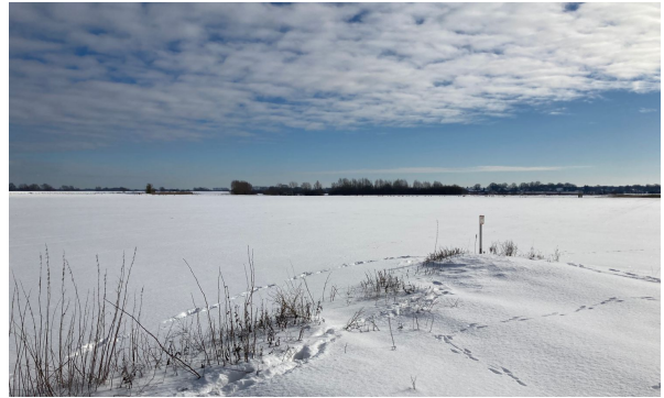
Ein Blick auf die Erweiterungsfläche GE Galgenberg

Letzte Aktualisierung des Profils GF-60043 am 26.02.2021.