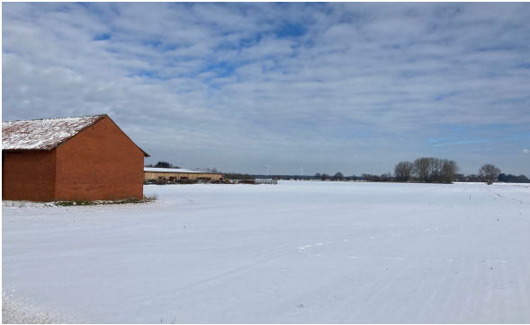
Freie Flächen im GE Galgenberg